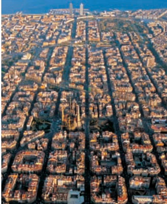
Panoràmica de l'Eixample