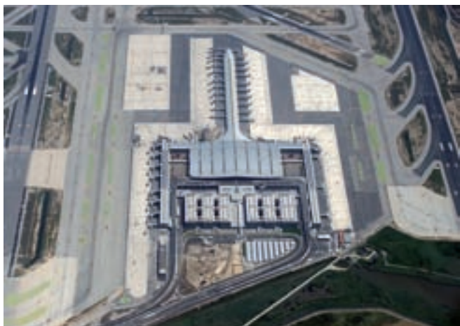
Nova terminal 1 de l'aeroport