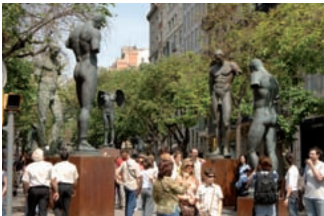
Rambla de Catalunya

Nota 4: Dades de la ciutat de Roma revisades respecte anys anteriors. Datos de la ciudad de Roma revisados respecto años anteriores. Data of the city of Rome revised with respect to previous years.